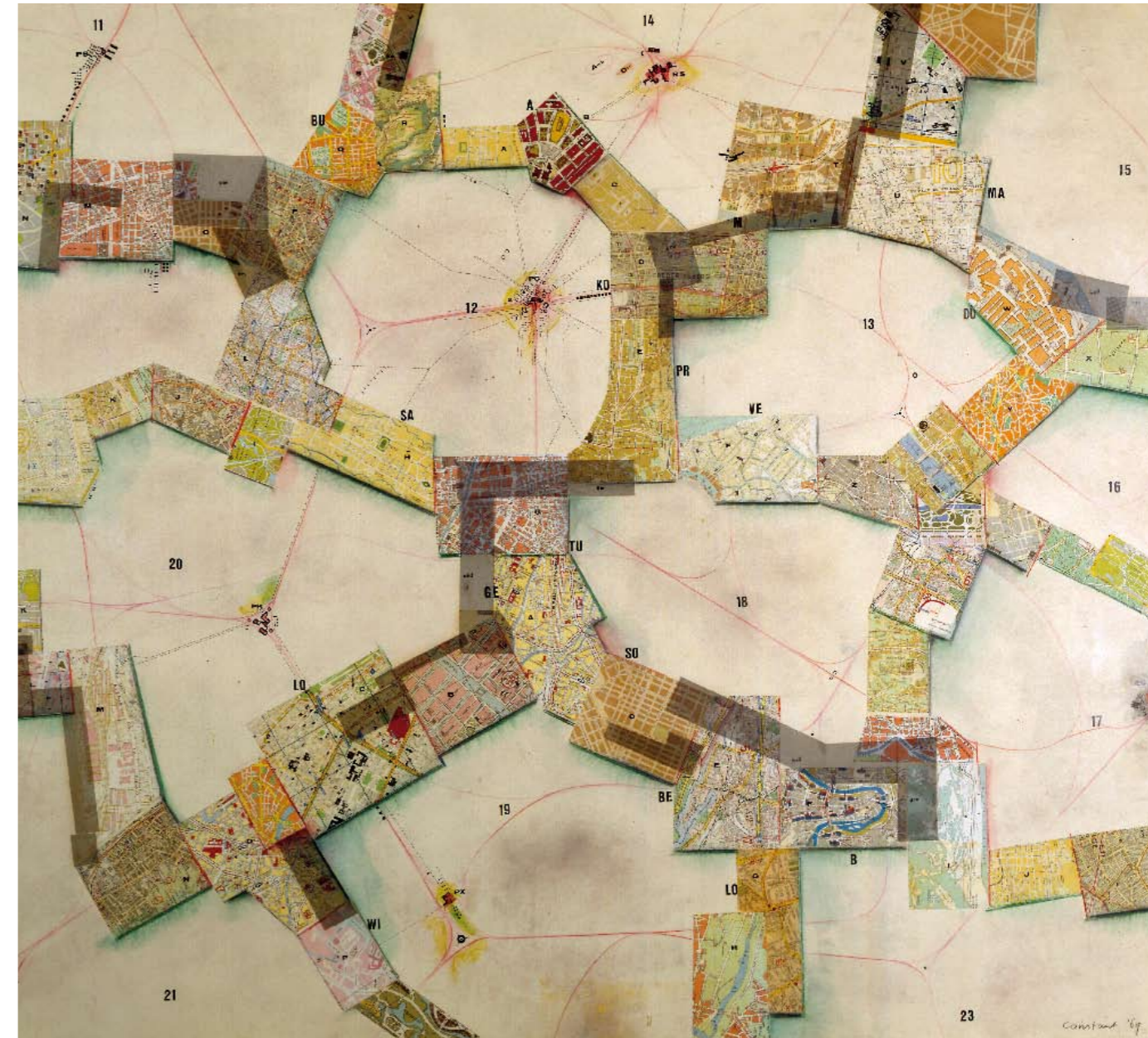
Symbolische voorstelling van New Babylon , 1969 Collage, 122 x 133 cm Collection of the Gemeentemuseum Den Haag