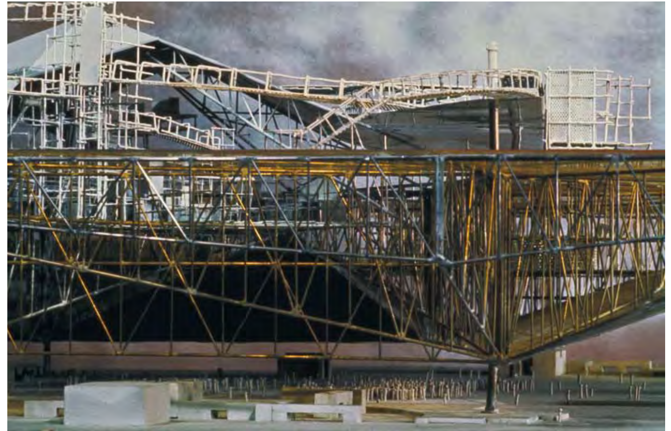
Victor Nieuwenhuijs & Maartje Seyferth Grote gele sector , film still from New Babylon de Constant , 2005 Film, 13 min., Digi Betacam

For Megastructure Reloaded , Nieuwenhuijs & Seyferth have developed an installation comprising several parts that places Constant's New Babylon in its cultural and political context by means of documentary film material while at the same time bringing it to life with slide projections of the collages and with suggestive moving shots of the model.