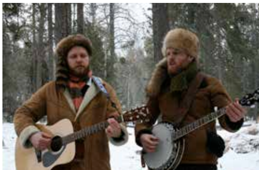
Ragnar Kjartansson, The End: Rocky Mountains , 2009

“My pop-star days are over,” fastslo Ragnar Kjartansson kategorisk i 2009. I tidligere år hadde Kjartansson opptrådt som frontfigur i grupper som Kanada, The Funerals og elektro-glamrockkvintetten Trabant, og han hadde en rekke albumer bak seg. Fram til 2005 spilte billedkunst en underordnet rolle i kunstnerskapet hans, og selv etter at det kunstneriske tyngdepunktet har skiftet over mot performance, har musikken forblitt et viktig aspekt ved arbeidene hans. I The Great Unrest (2005), en fire uker lang performance, står han i et avdanket, lite teater på sørkysten av Island, omgitt av kulisserester, skrot og utrangerte musikkmaskiner og spiller monotone bluesakkorder på gitaren. For Manifesta 7 laget han nok en musikalsk utholdenhets-performance, Schuhmann Machine (2008). Også God (2007), et tredje viktig arbeid i grensefeltet mellom musikk og kunst, var basert på en live-performance og fant sin endelige form som videoinstallasjon.